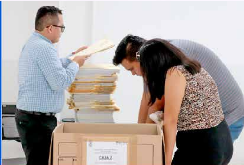
La LV Legislatura avanza en los trabajos preparativos para el proceso de entrega-recepción a través de la Secretaría de Servicios Legislativos y Parlamentarios de la Mesa Directiva del Congreso del estado.

La LV Legislatura avanza en los trabajos preparativos para el proceso de entrega-recepción a través de la Secretaría de Servicios Legislativos y Parlamentarios de la Mesa Directiva del Congreso del estado. A la fecha se recibieron los archivos físicos y electrónicos de parte de las y los diputados presidentes de cada una de las 30 comisiones y los cuatro comités representados en el Legislativo estatal, así como del Instituto de Investigaciones Legislativas (IIL), con el objetivo de dar cumplimiento a la Ley de Entrega Recepción de la Administración Pública para el Estado de Morelos y sus Municipios.