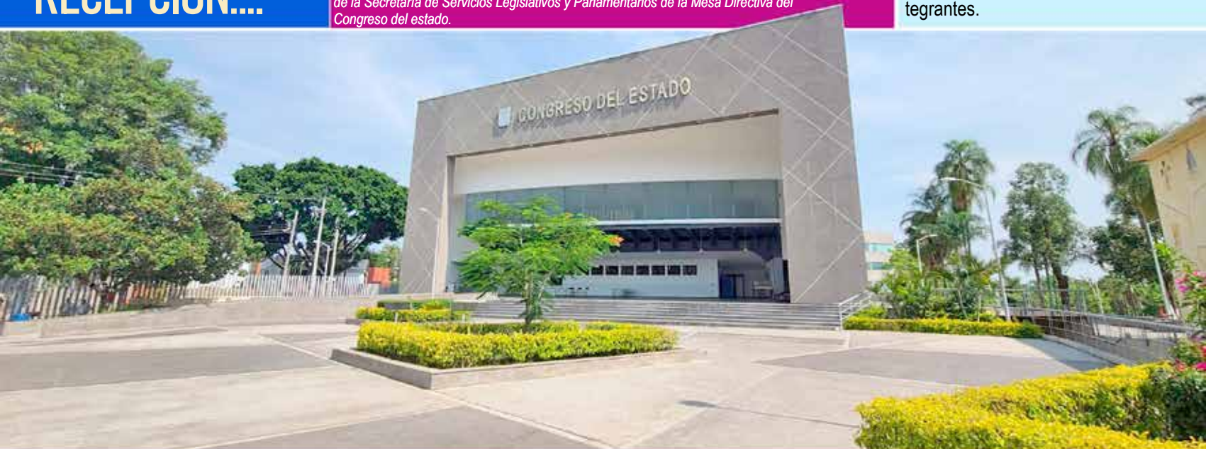
El Congreso del Estado cumplirá en tiempo y forma con los trabajos de entrega-recepción a lo que será la 56 Legislatura Local...

Será hasta el final de la legislatura cuando se concluirá con la entrega de la información restante que corresponde a las áreas administrativas, donde la Comisión Instaladora tendrá la función de preparar la junta previa y el proceso de entrega recepción, y actuará válidamente con la presencia de la mayoría de sus integrantes.