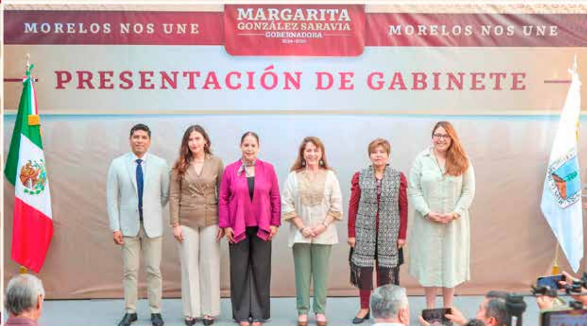
Estos son los reconocidos morelenses que formarán el Gabinete Social dentro del gobierno de Margarita González Saravia.