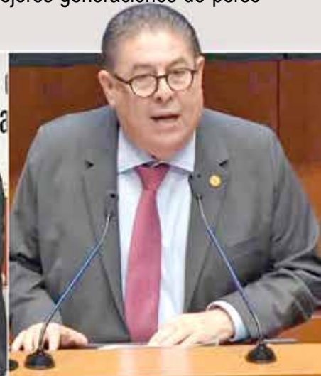
Desde la más alta tribuna del país, Víctor Mercado ha contribuido a sacar con éxito importantes propuestas de reforma a la Constitución General de la República.