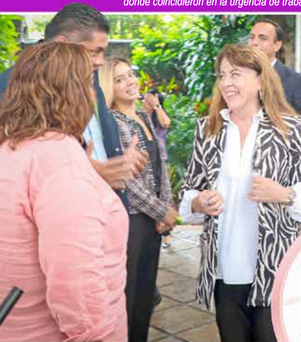
Ya en corto, los diputados intercambiaron amena charla con la gobernadora Margarita González Saravia.