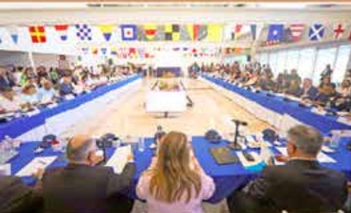
La gobernadora Margarita González Saravía presidió la instalación de la Comisión Consultiva del Aeropuerto Internacional de Cuernavaca "Mariano Matamoros", donde destacó que la reactivación de este espacio estratégico "traerá grandes beneficios para todas y todos los morelenses".