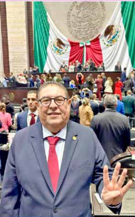
Este es Víctor Mercado, el morelense que representa en el Senado de la República con dignidad al Estado de Morelos.

El impulso del deporte entre jóvenes y menores de edad, la postura es generar las condiciones para que sea una forma de prevenir el delito, crear mejores generaciones de personas.