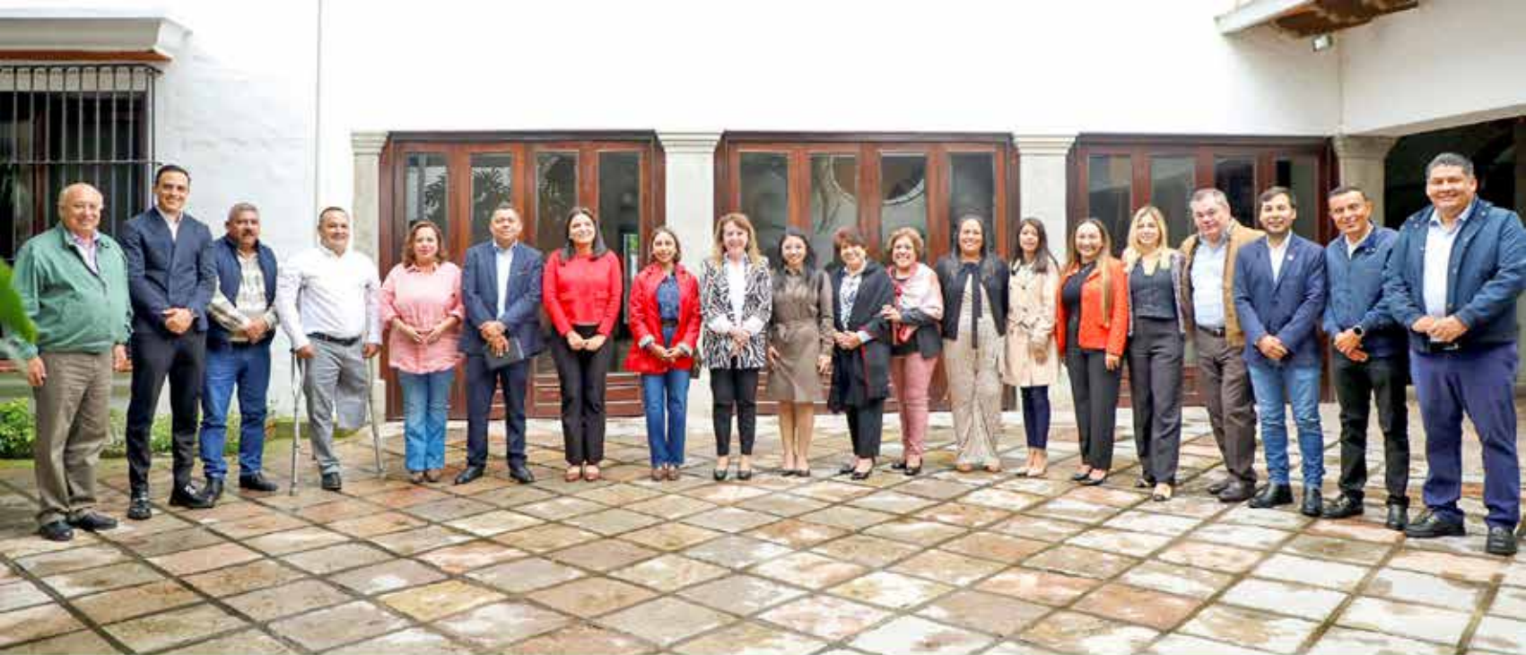
Las y los diputados de la LVI Legislatura del Congreso del estado de Morelos sostuvieron una reunión con la gobernadora Margarita González Saravia, donde coincidieron en la urgencia de trabajar de manera conjunta a favor del desarrollo y bienestar de las y los ciudadanos morelenses.