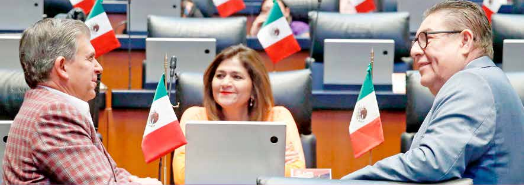
El intercambio de ideas y experiencias con el resto de sus compañeros, le ha permitido al Senador morelense Víctor Mercado un trabajo más enriquecedor en el Senado de la república.