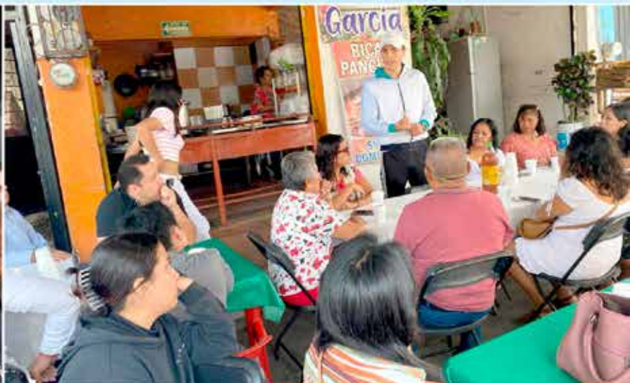
Con la política del bien común del Partido Acción Nacional (PAN), el diputado manifestó que su objetivo es apoyar todos los sectores sociales como es el caso de la juventud y avanzar por el desarrollo de la ciudad.