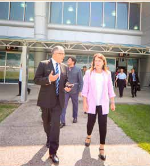
La gobernadora Margarita González Saravía, a su llegada a las instalaciones del aeropuerto "Mariano Matamoros".