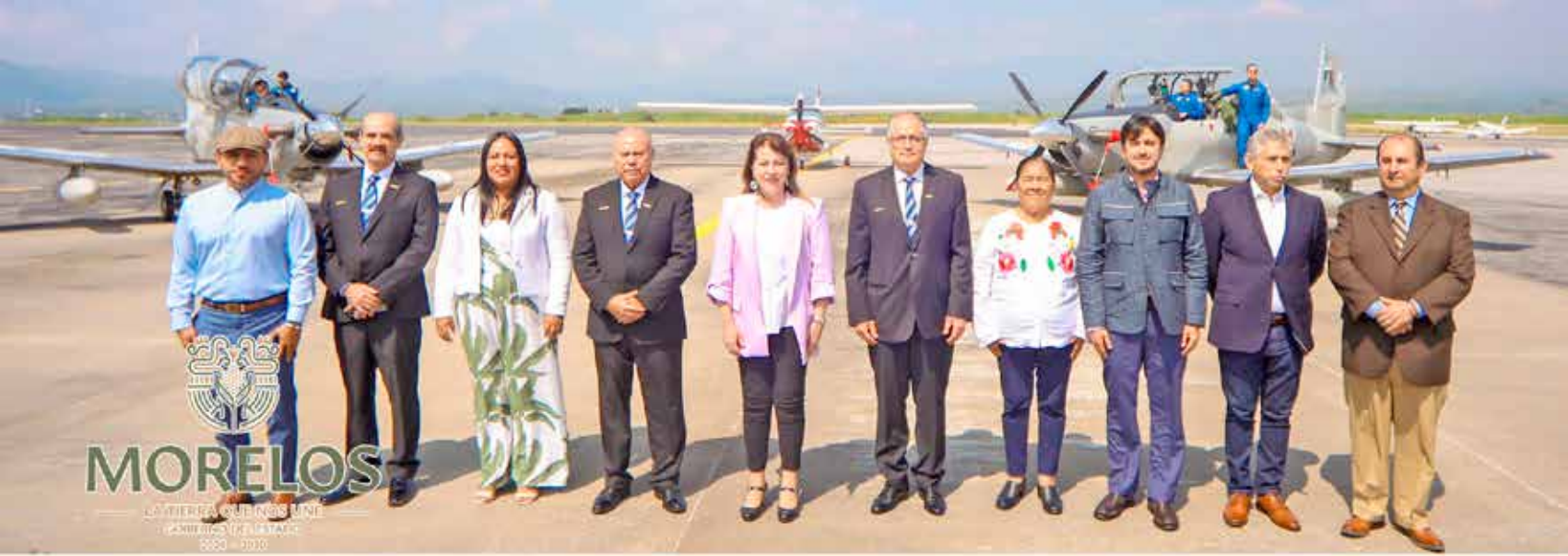
Este mega proyecto construido con gran visión por el ex gobernador Lauro Ortega Martínez, será ahora llevado a escenarios de desarrollo y economía.