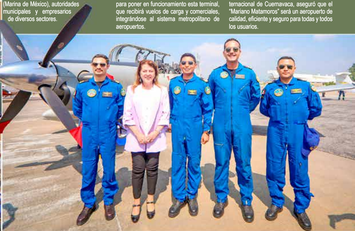
Con el apoyo de importantes empresas de aviación tanto comerciales como de carga, Margarita González Saravía, reactivará económicamente al internacional aeropuerto.